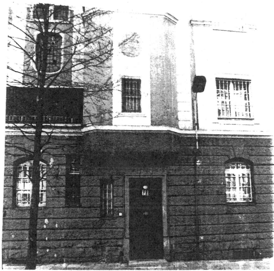
Personenein- und -ausgang Magdalenen- straße Nr. 14