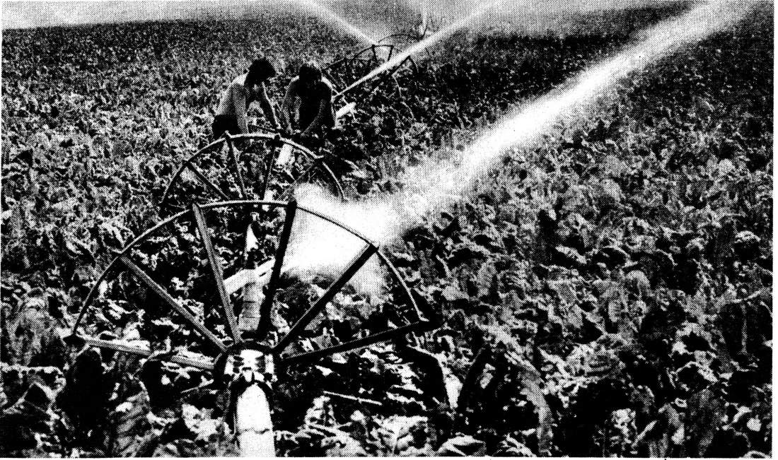
39,6 Prozent der Nutzfläche der Kooperation Hadmersleben wurden 1971 beregnet.