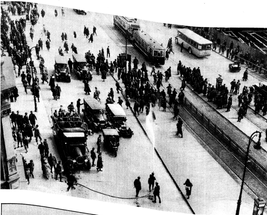
Der Kampf gegen den Imperialismus verlangt, alle demokratischen Kräfte unter der Führung der Partei zusammenzuschließen. (Unser Bild: Zusammenstöße in Berlin im Mai 1929.) Genosse Walter Ulbricht schrieb im Juni des gleichen Jahres: