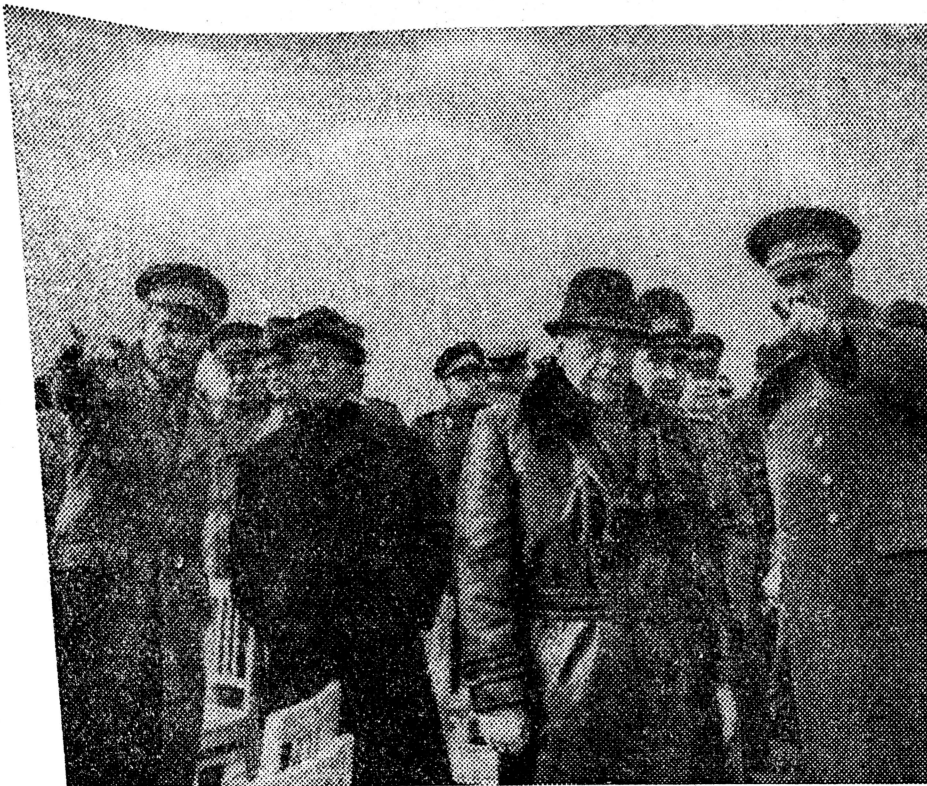
Die ständige Fürsorge der Sozialistischen Einheitspartei Deutschlands für die Streitkräfte zeigte sich auch beim Manöver »Oktobersturm«

Zu Ehren der für den zuverlässigen der Arbeiter- und dem Feind