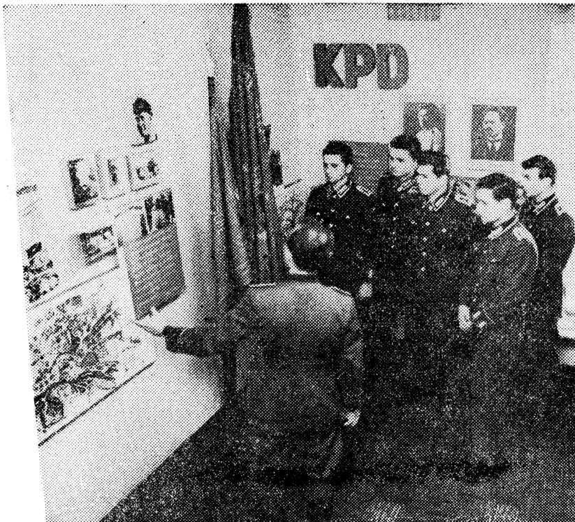
Ziel im Wettbewerb: Vielseitige politisch-ideologische Arbeit.