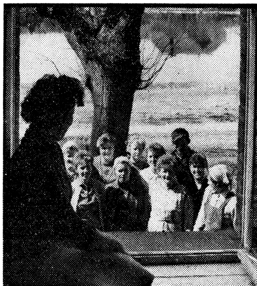
Fast alle Genossenschaftsbäuerinnen der LPG Bandelow im Kreis Strasburg sind Mitglieder des Dorfklubs. Hier bringt der Chor ein Geburtstagsständchen

Überall in unserer Deutschen Demokratischen Republik sprechen zahllose Frauen mit Recht davon, wie der Sozialismus ihr Leben tief beeinflußt und verändert hat, wie es inhaltsvoller und reicher geworden ist. Wir Frauen empfinden immer mehr Glück und Zufriedenheit darin, so wie für unsere eigene Familie für die große Familie unseres Volkes tätig sein zu können.