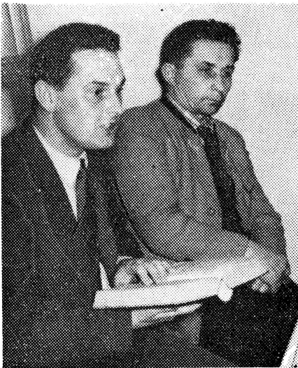
Der Propagandist liest aus Lenins Werken