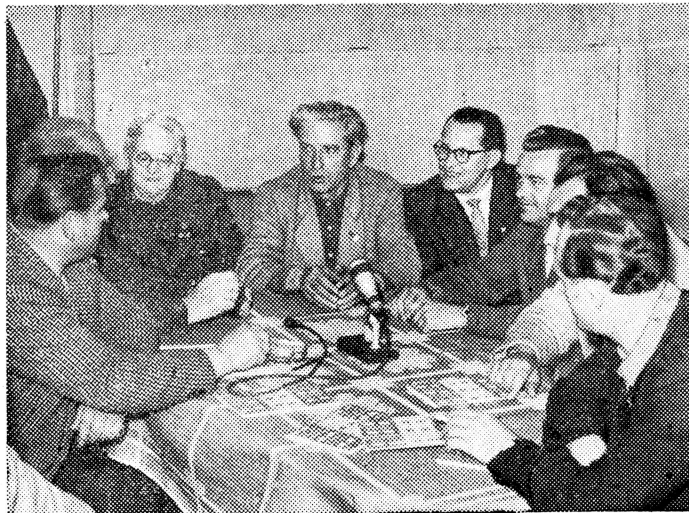
Gespräch am runden Tisch im Agitationszug

der Kreisleitung Lübben wird ausgewertet. Die Genossen der Kreisleitung haben als heutigen Einsatzort Rietzneuendorf vorgeschlagen, wo schon eine Brigade tätig ist. Dort sollen weitere Bauern für die LPG gewonnen, und das Gespräch mit allen Einwohnern über die Genfer Außenministerkonferenz soll weitergeführt werden. Im Wagen fahren Genossen der Kreisleitung und der Bezirksleitung mit. So ist der politische Einsatz schon vorbereitet, ehe wir noch ins Dorf rollen. Unser Agitationszug ist ja eine