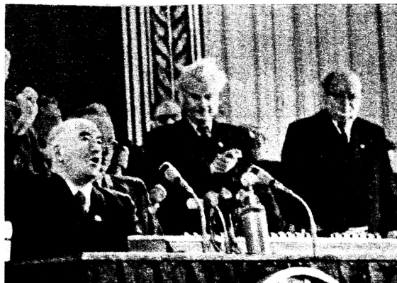
GENOSSE HARRY POLLITT