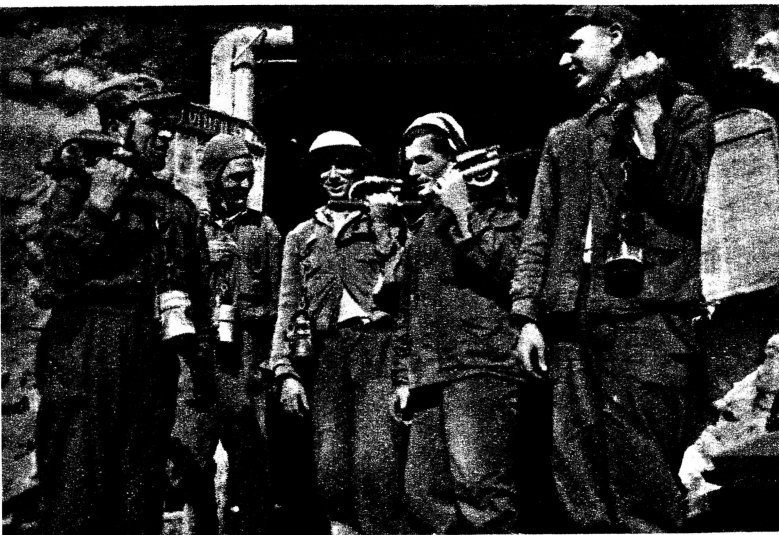
Unter Führung der Albanischen Partei der Arbeit kämpfen die Werktätigen mit großer Begeisterung um die Erfüllung ihres ersten Fünfjahresplans. Auf unserem Bilde albanische Arbeiter, die unter schwersten Bedingungen einen sieben Kilometer langen Tunnel für das neuerbaute große Wasserkraftwerk „W. I. Lenin“* ins Felsmassiv trieben.

Die Parteiorganisationen sind zusammen mit den Betriebsleitern und Gewerkschaftsorganisationen für die O