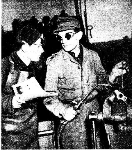
Die politische und kulturelle Entwicklung seiner Kollegen liegt ihm besonders am Herzen. Er erschöpft alle erdenklichen Möglichkeiten und bemüht sich, die Kollegen für politische Zirkel, für die Betriebsgewerkschaftsschule oder für berufliche Lehrgänge zu interessieren.