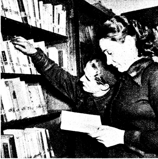
Von Zeit zu Zeit informiert er sich über die Neueingänge von fortschrittlicher Literatur in der Werksbibliothek. Bei seinen Diskussionen empfiehlt er den Kollegen, bestimmte Bücher zu studieren, damit sie auch von dieser Seite her Aufklärung erhalten.