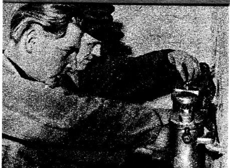
Die Genossen der Parteiorganisation der MAS Niedersachsen versäumen keine Gelegenheit, um mit den Bauern ihrer Orte über die Beschlüsse und Verordnungen unserer Regierung zu sprechen.