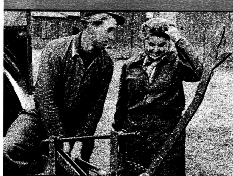
Die Genossen der Parteiorganisation der MAS Niedersachsen versäumen keine Gelegenheit, um mit den Bauern ihrer Orte über die Beschlüsse und Verordnungen unserer Regierung zu sprechen.