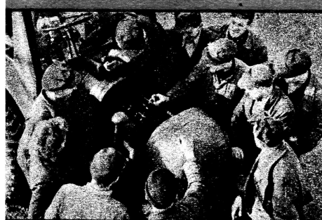
Die Genossen der Parteiorganisation der MAS Niedersachsen versäumen keine Gelegenheit, um mit den Bauern ihrer Orte über die Beschlüsse und Verordnungen unserer Regierung zu sprechen.