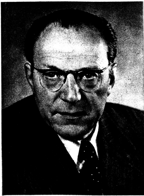
Otto Grotewohl Vorsitzender des Zentralkomitees