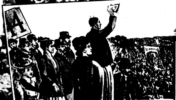
Die erste große Maidemonstration (300000 Teilnehmer) der Londoner Arbeiter im Hyde-Park 1699. Auf der Tribüne 14 waren Engels und Eleonore Marx (vorn Mitte) anwesend.