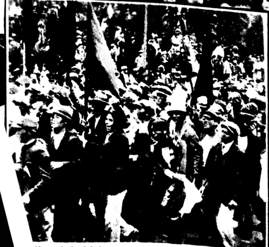
Koreanische Arbeiter in Demonstrationszug am 1.Mai 1929 in Toki<