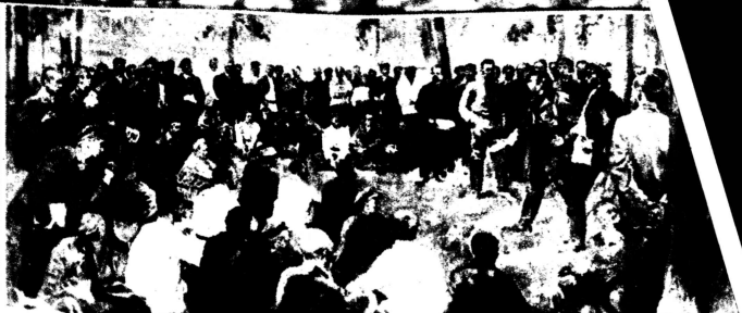
Majewka, die (illegale) rote Maifeier im zaristischen Rußland, spielte bei der Entwicklung der revolutionären Bewegung keine geringe Rolle.