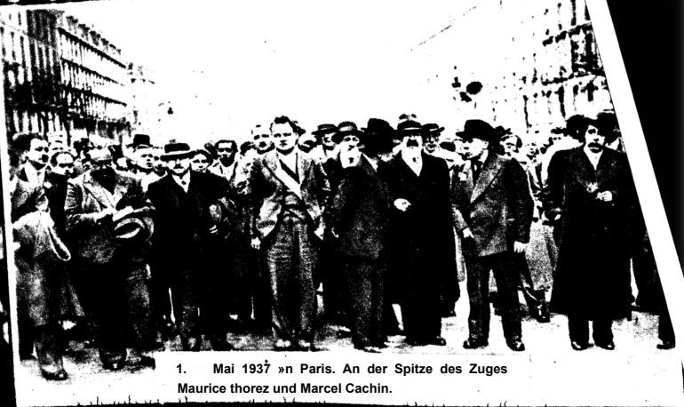
1. Mai 1937 »n Paris. An der Spitze des Zuges Maurice thorez und Marcel Cachin.