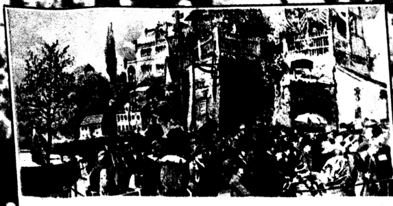
Zug der Dresdner Arbeiter nach Loschwitz am 1. Mai 1890.