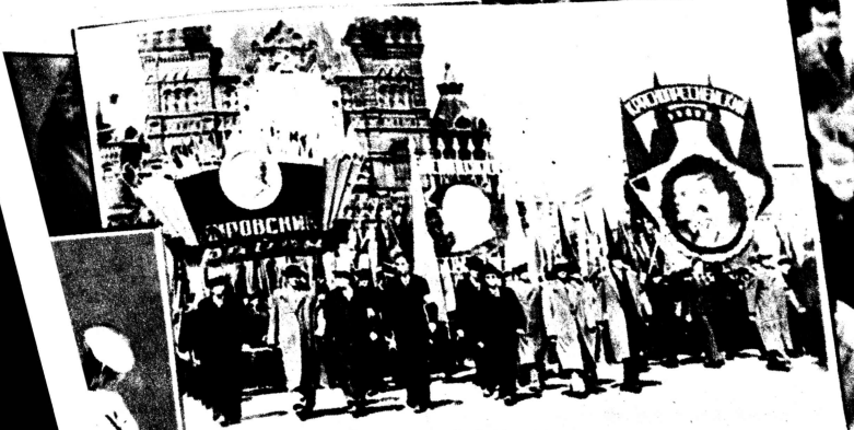
Am 1. Mai 1948 vor den Tribünen am Roten Platz in Moskau.