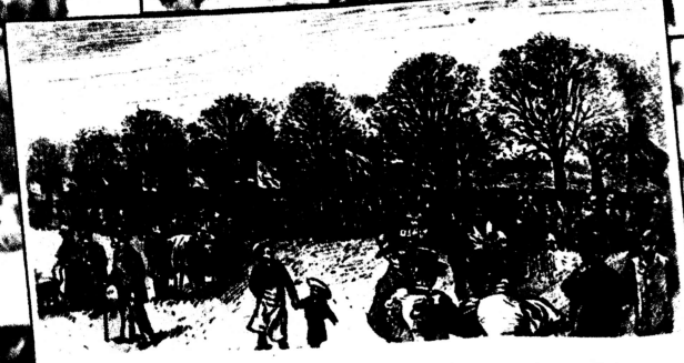
50000 Arb. «., d.mon»tn.r.t.n am 1.Mai 1090 Ir, KpP.,ba,gn.