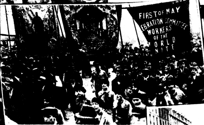
Ausschnitt aus der Maidemonstration der Londoner Werkstätigen im Hyde-Park 1929.