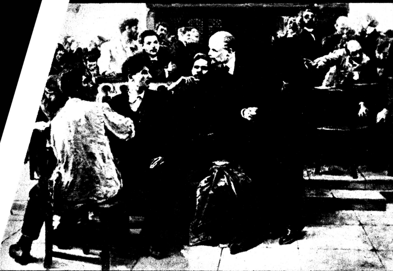
Eine Gruppe von Delegierten mit Lenin, Stalin und Gorki auf dem V. Parteitag der SDPRP in London 1907.