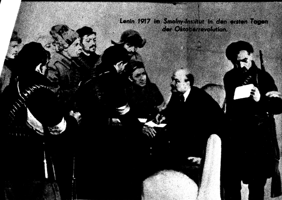
Lenin 1917 im Smolny-Institut in den ersten Tagen der Oktoberrevolution.