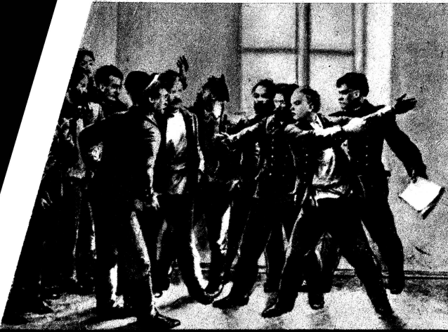
Der junge W. I. Uljanow (Lenin) bei einer Studentenversammlung in Kasan 1884.