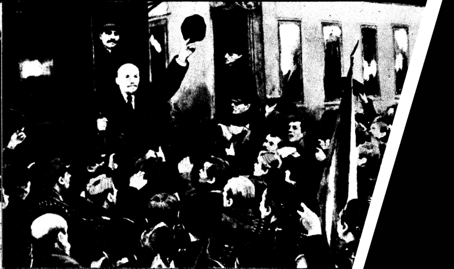
Lenin trifft nach langer Emigrationszeit am 16. April 1917 in Petroi bereits am nächsten Tag verkündete er seine berühmten Apriltim