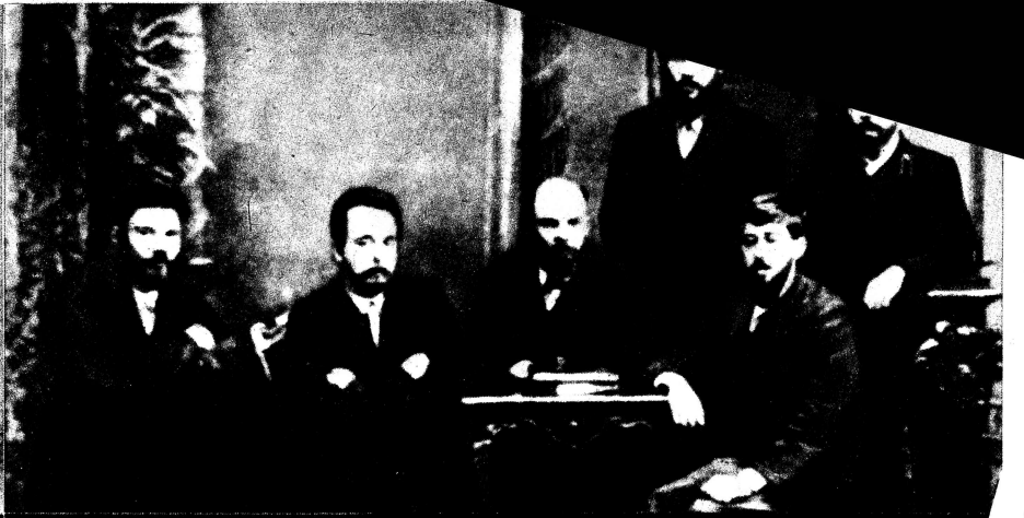
Mitglieder des „Kampfbundes zur Befreiung der Arbeiterklasse“ 1897 (Am Tisch in der Mitte: Lenin).