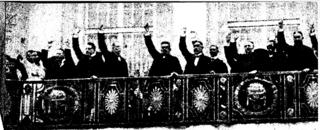
Oben: Am 31. Juli 1919 wird auf dem Balkon des Nationaltheaters in Weimar die „demokratische Verfassung der Welt“ ausgerufen. Die über Hindenburg mit Brüning, Schleicher und Papen geadelten Weg zum Faschismus führt