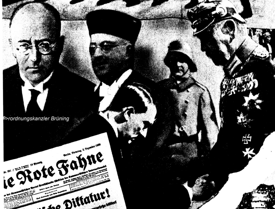
→ ordnungskanzler Brüning