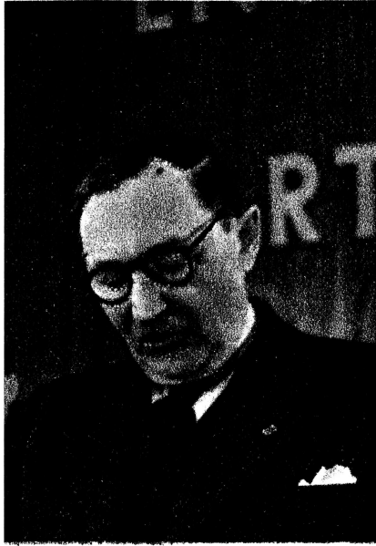
ZDBHBK BIBRLINOBR TSCHECHOSLOWAKEI

„Wir sind überzeugt, daß Frieden und International* Zusammenarbeit dort kein* leeren Phrasen sind, wo die Taten der Menschen und Volker von der erhabenen Idee des Sozialismus bestimmt werden.“