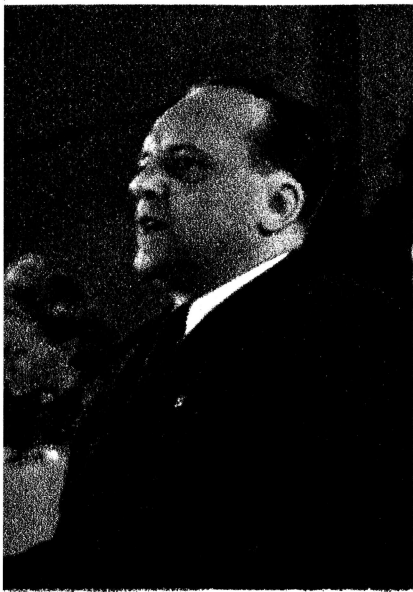
J08BF HORM ÖSTERREICH

* „Der Dollar stellt eine große Macht dar, aber eine viel größere Macht Ist die Kraft des einfachen Volkes, wenn es sich unter der Führung einer Partei befindet, die von den Lehren von Marx, Engels, Lenin und Stalin Inspiriert und geleitet wird.“