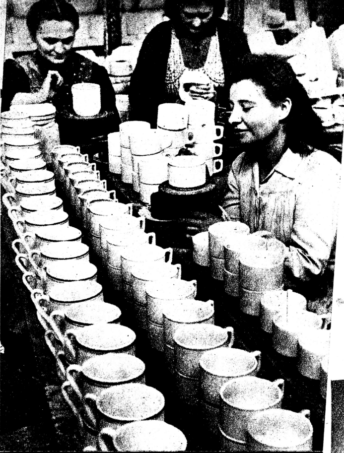
In der früheren Abteilung für technisches Porzellan wird heute Gebrauchsgeschirr hergestellt. Fleißige Frauenhände versehen im Akkordlohn das Geschirr mit malerischen Verzierungen.