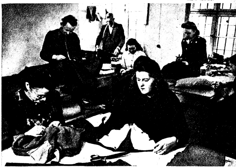
Eine Betriebs-Schneiderwerkstatt für Ausbesserung und Aufarbeitung von Belegschaftskleid